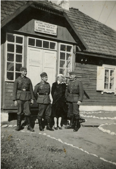
Budynek posterunku policji w Połukniu

W piątym paragrafie rozporządzenia z 17 lutego 1942 r. „w sprawie uzupełnienia przepisów na zajętych terenach wschodnich” zapowiedziano zastosowanie surowszego prawa w stosunku do Polaków i Żydów, odpowiednio do przepisów „rozporządzenia o prawie karnym dla Polaków i Żydów na wschodnich ziemiach wcielonych z 4 grudnia 1941 roku”. Tak więc Polaków i Żydów można było karać śmiercią, a w lżejszych wypadkach karą więzienia, gdy wrogo działali wobec Niemców np.: uszkadzając obwieszczenia władz i urzędów niemieckich, a także stosując akcje prowokacyjne.