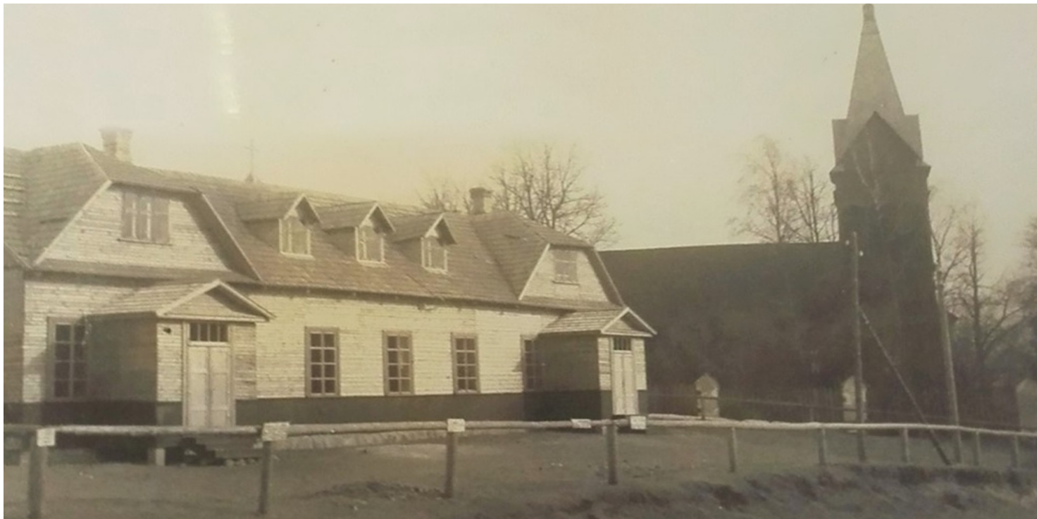
Dom Ludowy i kościół w Połukniu.

https://przystanekhistoria.pl/pa2/teksty/103594,Zbiorowa-egzekucja-odwetowa-dokonana-25-czerwca-1941-r-w-Polukniu.html