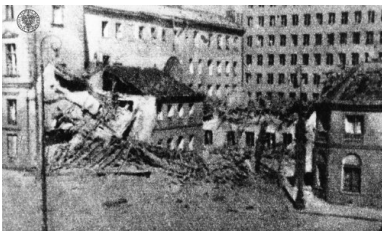
Pałac Blanka na pl. Teatralnym po bombardowaniu.

Po 63 dniach powstania lewobrzeżna Warszawa stała się w morzem ruin. Szacuje się, że na skutek walk, ostrzałów artyleryjskich i bombardowań, zniszczeniu uległo od 25% do 30% substancji miasta, w tym zarówno zabudowy mieszkalnej, jak i budynków użyteczności publicznej oraz sakralnej (np. kościół św. Aleksandra na placu Trzech Krzyży, św. Andrzeja na pl. Teatralnym, kościół św. Marcina na ul. Piwnej). Na Starym Mieście tylko jedna kamienica, przy ul. Długiej 6, nadawała się do zamieszkania. Ucierpiały również Śródmieście, Wola, Mokotów, Powiśle.