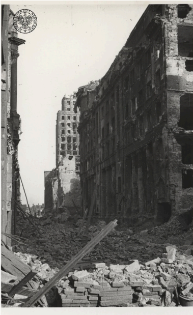
Ruiny domów, w tle widoczny fragment zniszczonego Prudentialu. Zdjęcie pochodzące z albumu z fotografiami z czasów