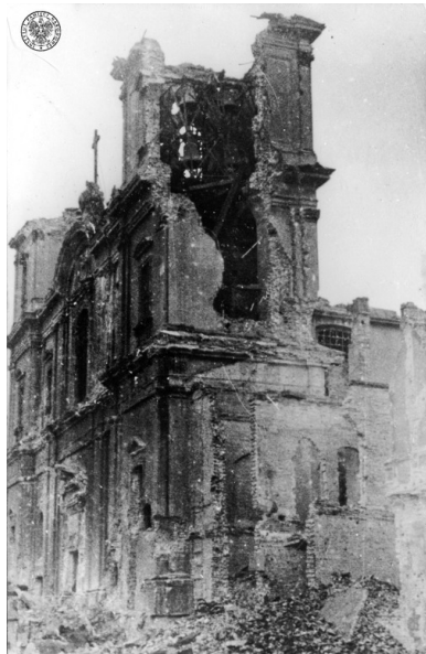
Zniszczony kościół św. Krzyża na Krakowskim Przedmieściu w Warszawie, sierpień-wrzesień 1944 r.

Całkowitej destrukcji miasta dopełniły oddziały Brandkommando oraz Sprengkommando , które paliły i wysadzały szczątki warszawskich budynków. Demontowano i wywożono również urządzenia fabryczne, a także majątek z prywatnych mieszkań. Szacuje się, że na skutek tego bezsensownego aktu spustoszenia, trwającego 110 dni po upadku powstania warszawskiego, 35-40% zabudowy miasta uległo destrukcji.