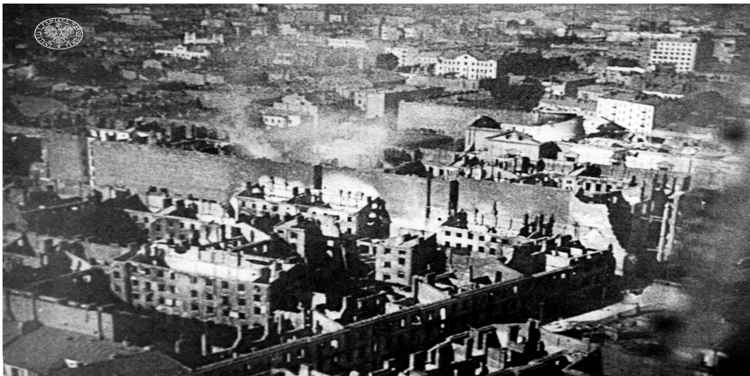
Płonące i wypalone domy.

https://przystanekhistoria.pl/pa2/teksty/103498,Zastraszajacy-przyklad-dla-calej-Europy.html