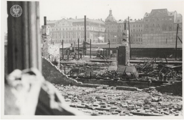
Ruiny przed Hotelem Polonia. Fot. Henryk Śmigacz. Zdjęcie pochodzące z albumu z fotografiami z czasów powstania warszawskiego oraz okresu powojennego, wchodzącego w skład Archiwum osobistego Henryka Śmigacza, pozyskanego do zasobu IPN w ramach projektu Archiwum Pełne Pamięci