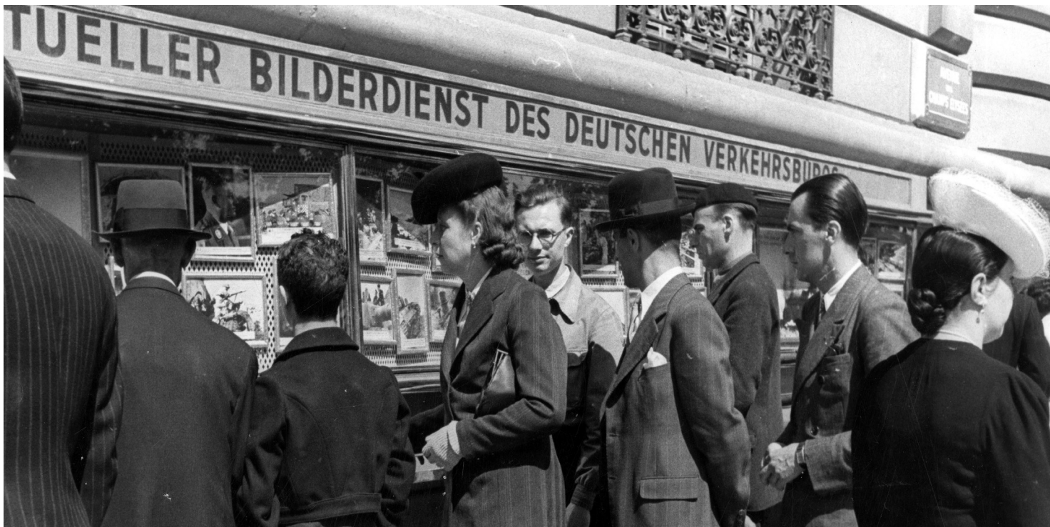
Ludzie przed wystawami zdjęć z terenów wojny, 1943 r. Fot. z zasobu NAC

https://przystanekhistoria.pl/pa2/teksty/103462,Siec-F-2-Polska-organizacja-wywiadowcza-w-okupowanej-Francji.html