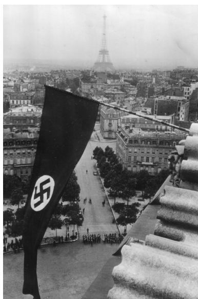
Panorama Paryża z łuku Triumfalnego. Widoczny sztandar ze swastyką zatknięty na szczycie łuku oraz Wieża Eiffla, czerwiec 1940 r.