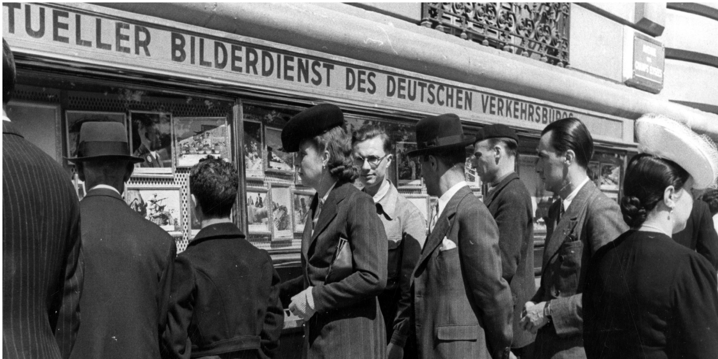
Ludzie przed wystawami zdjęć z terenów wojny, 1943 r.

https://przystanekhistoria.pl/pa2/teksty/103462,Siec-F-2-Polska-organizacja-wywiadowcza-w-okupowanej-Francji.html