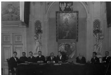
Zjazd Związku Strzeleckiego w Warszawie, 1925 r.

Krakowie i stąd dowodzić dywersją pozafrontową.