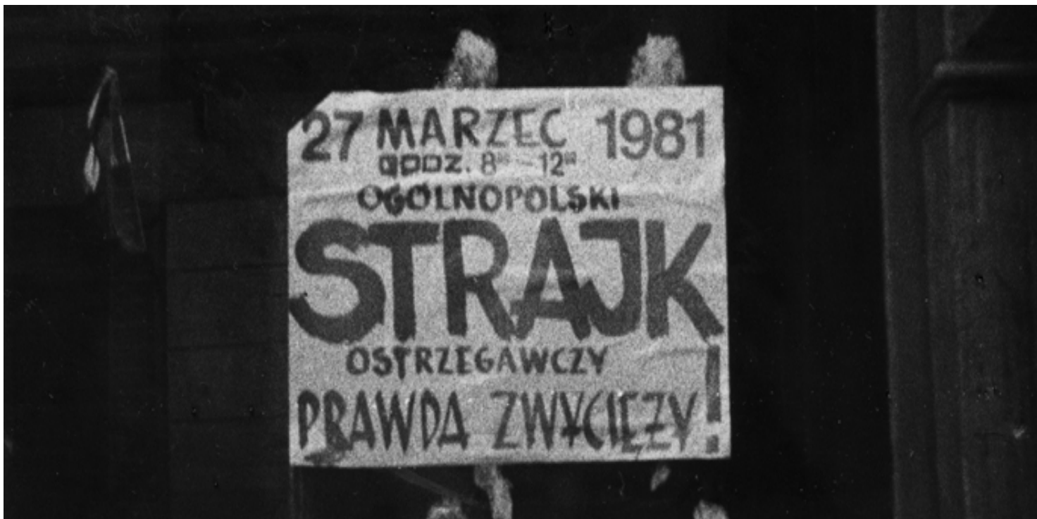
Plakat z marca 1981 r.

https://przystanekhistoria.pl/pa2/teksty/103384,Droga-do-konfrontacji.html