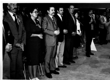
I Krajowy Zjazd Delegatów NSZZ „Solidarność” w Gdańskiej Hali Olivia