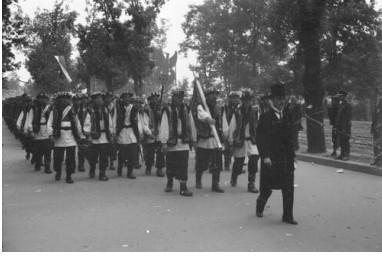
Stanisław Klimecki prowadzący defiladę koła żołnierzy 2. Pułku Piechoty Legionów, ubranych w tradycyjne huculskie stroje.

W połowie maja 1915 r. pod Mamajowcami Klimecki został ranny i dostał się do niewoli. Dwa lata spędził w obozie jenieckim, z którego w lipcu 1917 r. zbiegł i przedostał się do Charkowa, gdzie pod przybranym nazwiskiem Wróblewski pracował jako nauczyciel w gimnazjum i Uniwersytecie Ludowym; działał również w POW. Po rewolucji październikowej przedarł się przez linię frontu pod Tarnopolem i dołączył do Polskiego Korpusu Posiłkowego. Gdy na wieść o podpisaniu traktatu brzeskiego polskie oddziały wypowiedziały posłuszeństwo austriackiemu dowództwu, Klimecki wziął udział w próbie przebicia się pod Rarańczą do polskich formacji w Rosji. Zatrzymany przez Austriaków, został osadzony w obozie internowania w Witkowicach koło Krakowa, a następnie wcielony do armii austro-węgierskiej.