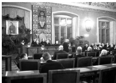
Uroczystość pożegnania ustępującego prezydenta Władysława Beliny- Prażmowskiego w sali Rady Miejskiej Krakowa z udziałem Stanisława Klimeckiego.

Wkrótce sformowano kompanię huculską Legionów Polskich, której dowództwo objął pod koniec grudnia 1914 r. Stanisław Klimecki, awansowany na chorążego za odwagę w boju pod Mołotkowem. Jego podkomendni przenikali w huculskich strojach za linie frontu i dostarczali legionowemu dowództwu informacji o przeciwniku. Wkrótce kompania trafiła na Bukowinę, gdzie toczyła walki m.in. pod Kirlibabą. 14 marca Klimecki, „za osobistą dzielność i wzorowe prowadzenie powierzonych oddziałów”, został awansowany na podporucznika.