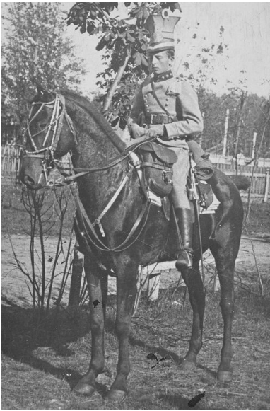
1915 r. Porucznik Stanisław Grzmot-Skotnicki.

U progu wojny znalazł się w Krakowie, gdzie wstąpił do tworzącej się 1. kompanii kadrowej. Nie przypuszczał, że już 2 sierpnia 1914 r. stanie przed zadaniem, które przez samego Józefa Piłsudskiego było określane jako straceńcza misja.