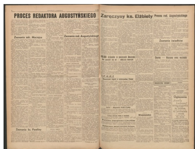
Strony „Gazety Ludowej” z 5 sierpnia 1947 r.

Więcej interesujących materiałów na profilu Archiwum IPN