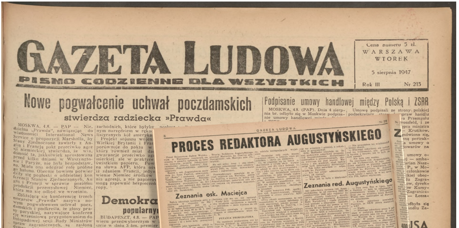
„Gazeta Ludowa” z 5 sierpnia 1947 r.

https://przystanekhistoria.pl/pa2/teksty/102601,Smierc-za-prawde-Proces-w-sprawie-Gazety-Ludowej.html