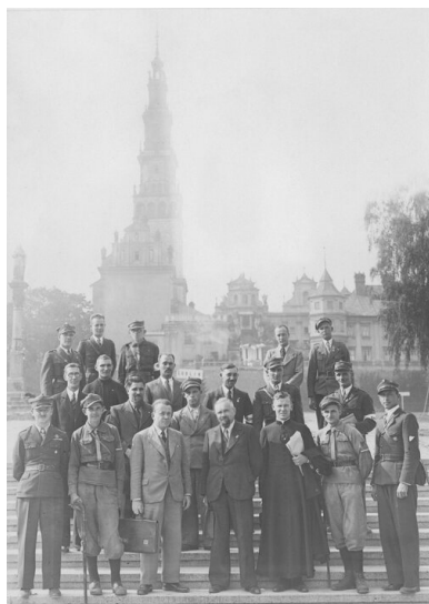
Komenda zlotu Katolickiego Stowarzyszenia Młodzieży Męskiej przed klasztorem w Częstochowie, wrzesień 1938