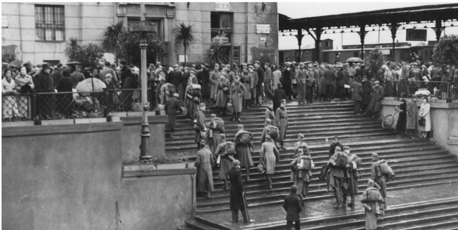
Żołnierze niemieccy na dworcu w Łodzi, 1940 r.

https://przystanekhistoria.pl/pa2/teksty/102420,Tajne-komplety-Teofila-Katry-19011983.html