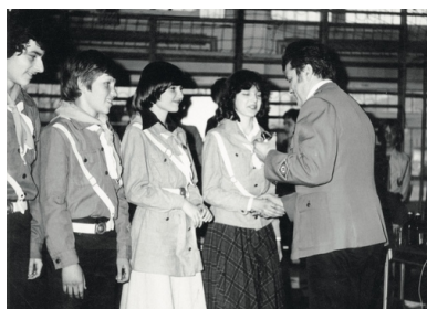
Oficer MO wręcza nagrodę harcierzom, lata osiemdziesiąte

Poddani propagandzie ludzie stawiali jej opór. Można by zatem uznać, że prowadzona odgórnie laicyzacja zakończyła się fiaskiem. Jednak gdy spojrzymy na jej ówczesną agendę, znajdziemy tam szereg postulatów, które w kolejnej epoce wróciły, choć odarte już z niemodnego, peerelowskiego sztafażu.