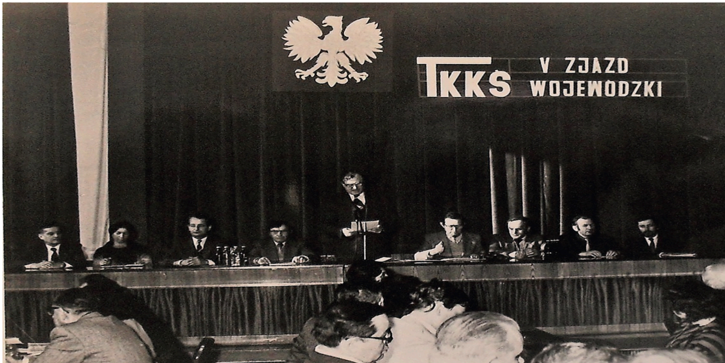
V Zjazd wojewódzki TKKS w Rzeszowie, 1986 r.

https://przystanekhistoria.pl/pa2/teksty/102084,Peerelowska-laicyzacja-w-mikroskali-instalowanie-swieckosci-na-Suwalszczyznie.html