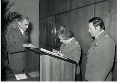
Uroczystość nadania imion w Urzędzie Stanu Cywilnego, 1983 r.