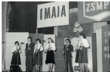
Akademia z okazji Święta Pracy, lata osiemdziesiąte

Jak się okazało, istniały jednak trudności w zapewnieniu lektorów mogących we właściwym świetle przedstawić kwestię laicyzacji, zwłaszcza w gminach. W związku z tym w kooperacji z TKKŚ i ZHP zakładano w szkołach Koła Młodych Racionalistów. Propagowano też „śluby organizacyjne” zawierane w kręgu działaczy ZSMP, jednak nie cieszyły się one popularnością.