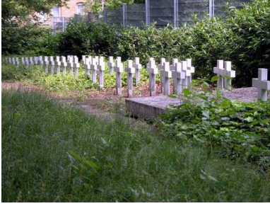
Cmentarz przy Hochstraße w Brunszwiku