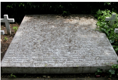
Nagrobek z nazwiskami zamordowanych polskich dzieci na cmentarzu Hochstraße

Kobiety przebywały w placówce przy Broitzemer Straße 200 osiem dni po rozwiązaniu. Następnie były odsyłane do pracy, niezależnie od stanu, w jakim się znajdowały.