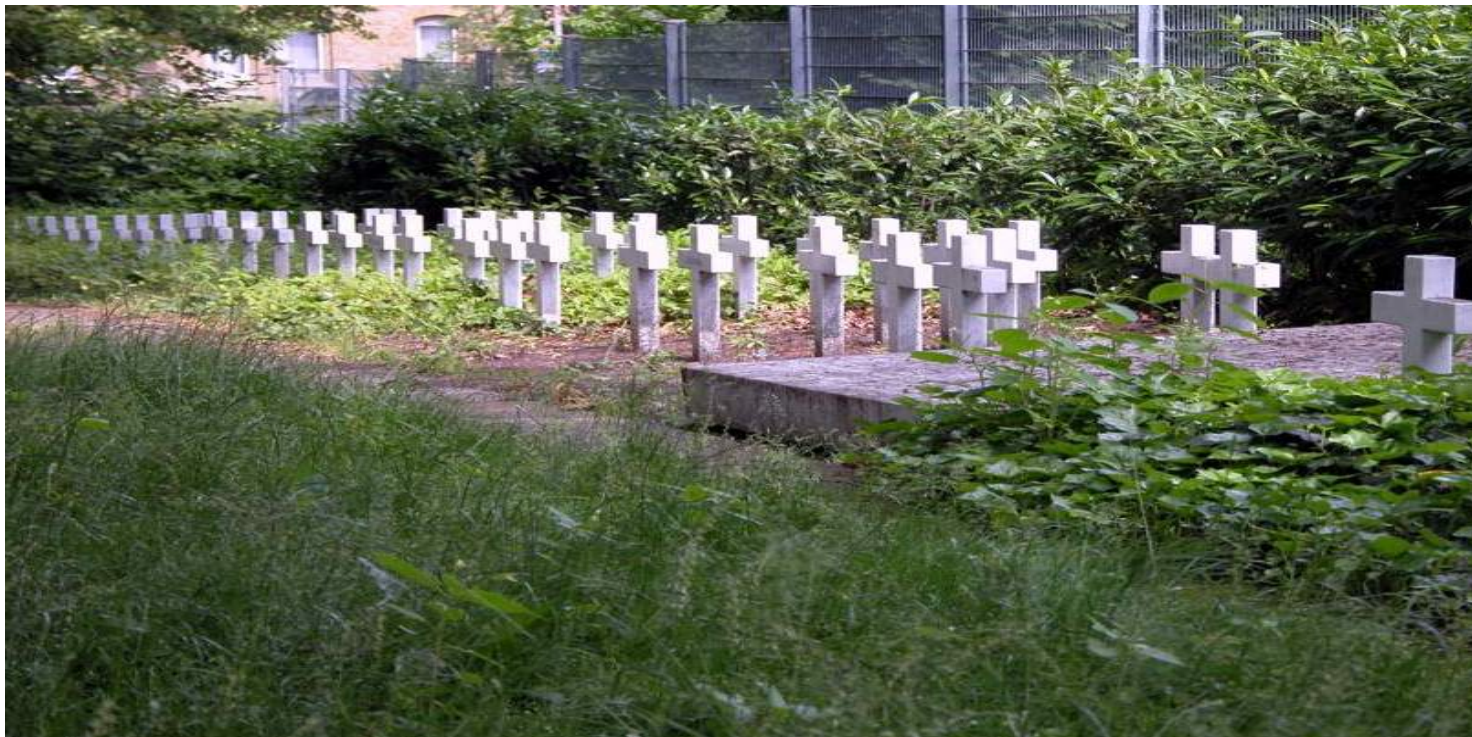
Cmentarz przy Hochstraße w Brunshwiku

https://przystanekhistoria.pl/pa2/teksty/102060,Tragiczne-losy-polskich-robotnic-przymusowych-i-ich-dzieci-Dzialalnosc-zakladu-p.html