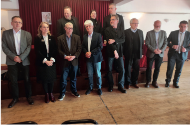
Uczestnicy konferencji

Tekst pochodzi z numeru 7-8/2022 „Biuletynu IPN”