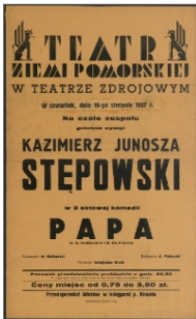
Afisz teatralny z 1937 r.