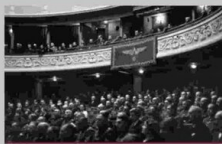
Wojciech Kilar, 1944, 1945, 1946, 1947, 1948, 1949, 1950, 1951, 1952, 1953, 1954, 1955, 1956, 1957, 1958, 1959, 1960, 1961, 1962, 1963, 1964, 1965, 1966, 1967, 1968, 1969, 1970, 1971, 1972, 1973, 1974, 1975, 1976, 1977, 1978, 1979, 1980, 1981, 1982, 1983, 1984, 1985, 1986, 1987, 1988, 1989, 1990, 1991, 1992, 1993, 1994, 1995, 1996, 1997, 1998, 1999, 2000, 2001, 2002, 2003, 2004, 2005, 2006, 2007, 2008, 2009, 2010, 2011, 2012, 2013, 2014, 2015, 2016, 2017, 2018, 2019, 2020, 2021, 2022, 2023, 2024, 2025