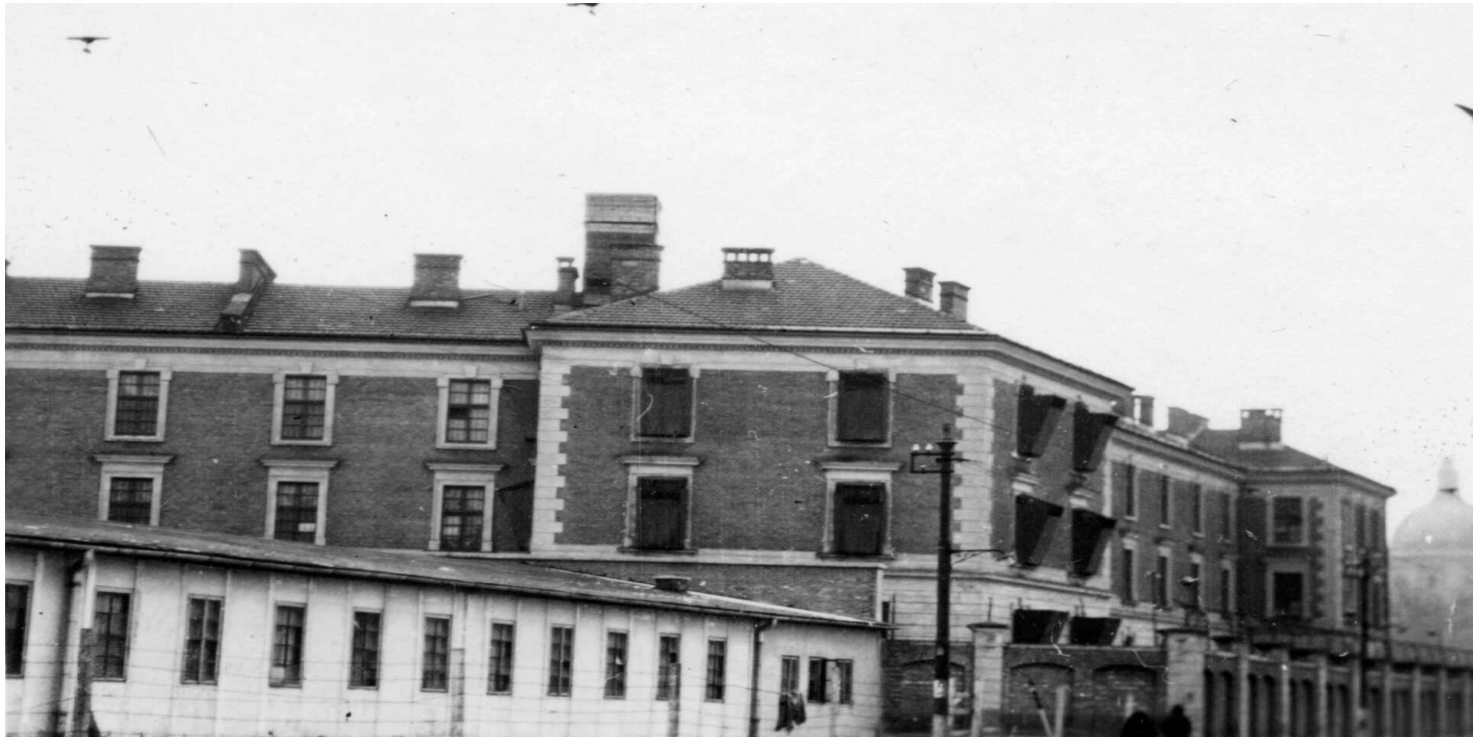
Budynek więzienia prz ul. Montelupich w Krakowie

https://przystanekhistoria.pl/pa2/teksty/101914,Najwazniejszy-skok-w-zyciu-Ucieczka-Stanislaw-Marusarza-z-wiezienia.html