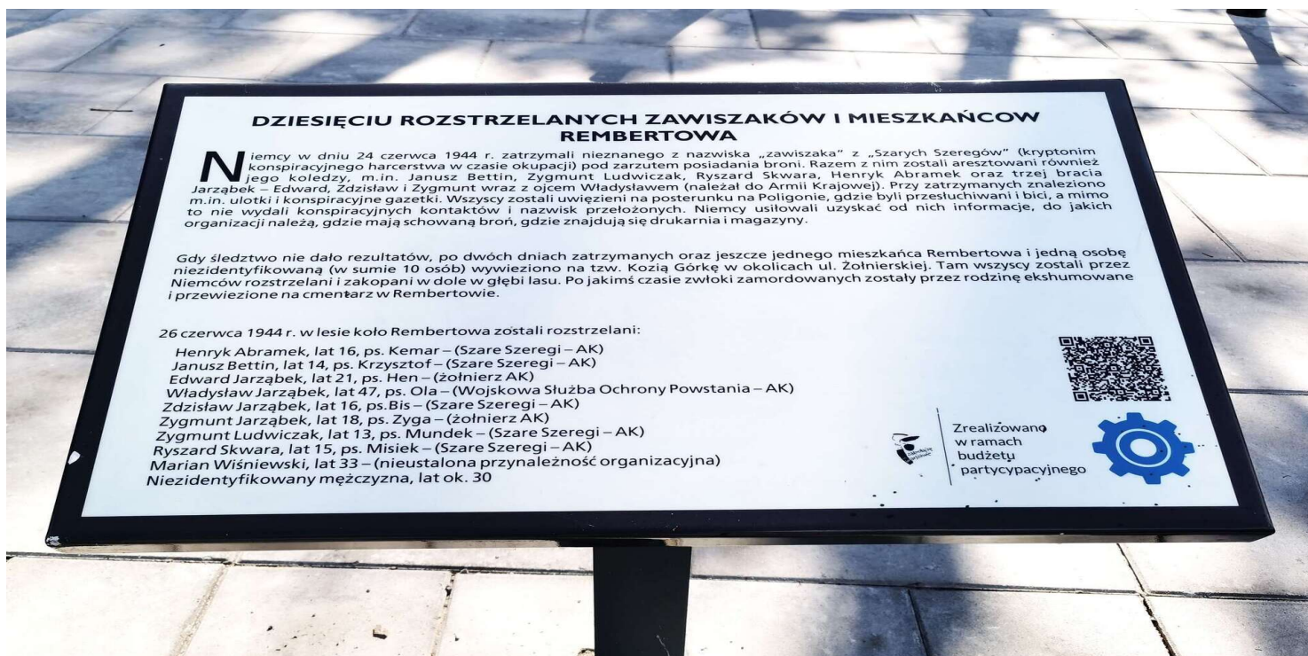
Tablica pamięci znajdująca się przy ul. Zesłańców Polskich u wylotu ul. Magenta w Warszawie-Rembertowie dot. dziesięciu rozstrzelanych mieszkańców Rembertowa

https://przystanekhistoria.pl/pa2/teksty/101775,Mord-w-Rembertowie.html