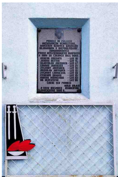
Tablica pamiątkowa umieszczona na budynku LI Liceum Ogólnokształcącego im. Tadeusza Kościuszki w Warszawie-Rembertowie, ul. Kadrowa 9

Wyjaśniła, iż syn był miłośnikiem fotografii i mimo młodego wieku robił zdjęcia własnym aparatem. Sfotografował na potrzeby konspiracji egzekucję, dokonaną przez Niemców 16 października 1942 r. w Rembertowie, gdy powieszono 10 mężczyzn koło stacji kolejowej. Zdjęcia są o tyle cenne, iż dzięki nim imię i nazwisko dziecka z listy ofiar zyskuje konkretną twarz, przez co bardziej trafia do świadomości.