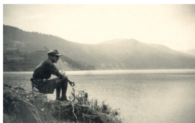
Franciszek Blachnicki na obozie harcerskim.

Należał do pokolenia urodzonego podczas powstańczych zmagania o przynależność Śląska do Polski. Wychowany w śląskiej, katolickiej, polskiej rodzinie o tradycyjnej religijności z pełnym zapalem zaangażował się w harcerstwo. W koncepcjach pedagogicznych polskiego harcerstwa łączących skauting z nurtem patriotycznym i abstynenckim widział świetną drogę wychowywania młodych ludzi.