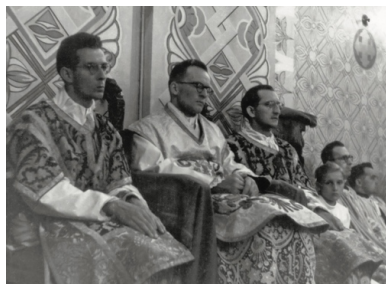
Diakon Franciszek Blachnicki (trzeci z lewej).

Ksiądz Blachnicki protestujący w obronie działań na rzecz trzeźwości narodu trafił do więzienia. W czasie okupacji niemieckiej został skazany na śmierć za działalność wojskową w obronie wolności rodaków; w tej samej sali po blisko dwudziestu latach był sądzony za działalność religijno-moralną na rzecz ich trzeźwości. Teraz, gdy realizował ewangeliczne ideały kształtowania człowieka i społeczeństwa wolnego, wyzwolonego od obyczaju alkoholowego, broniącego czystości i życia nienarodzonych, znów spotykał się ze sprzeciwem opresyjnej władzy lękającej się wychowania ludzi do wolności. Służba tym ideałom będzie wytyczać kolejne etapy jego życia. Czas spędzony w celi potraktował jako „rekolekcje więzienne”.