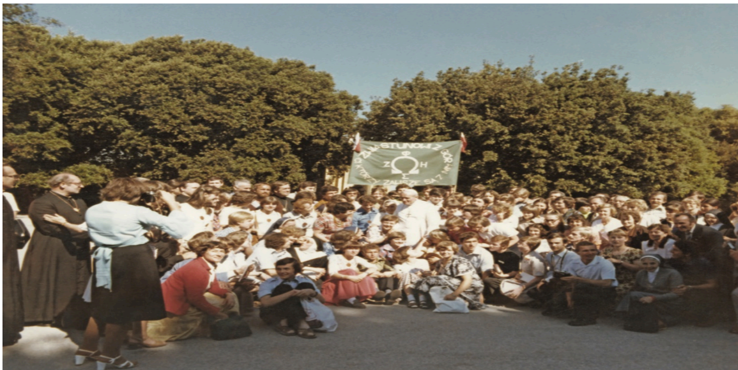
Pamiątkowa fotografia uczestników pierwszej oazy rzymskiej z Janem Pawłem II, 12 VIII 1979 r.

https://przystanekhistoria.pl/pa2/teksty/101730,Od-wolnego-czlowieka-do-wolnego-narodu.html