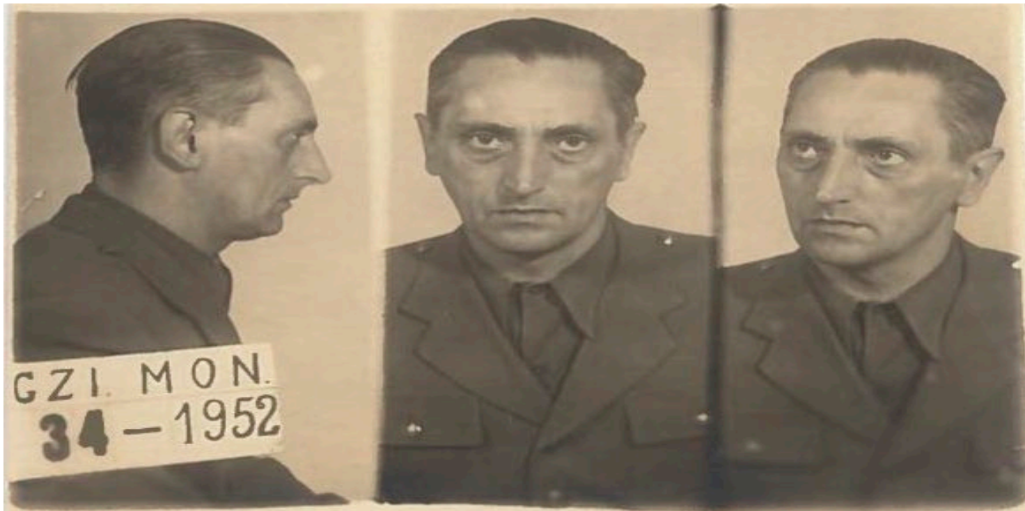
Zdjęcie aresztowe

https://przystanekhistoria.pl/pa2/teksty/101620,Proces-plk-Czeslaw-Naruszewicza-jako-przyklad-sprawy-tatarowskiej.html