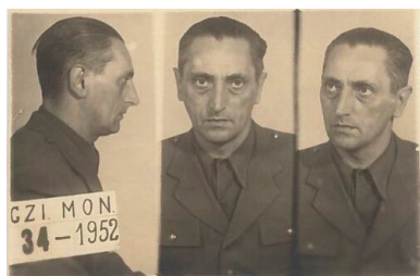
Zdjęcie aresztowe