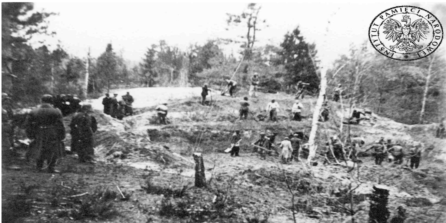
Pierwsza ekshumacja oficerów WP zamordowanych przez NKWD w Katyniu. Katyń, 16 IV 1943 r.

https://przystanekhistoria.pl/pa2/teksty/101562,Kazimierz-Skarzynski-W-obronie-prawdy.html