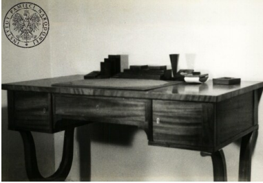
Biurko ze skrytkami na materiały legalizacyjne, 1948 r.