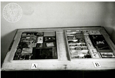
Stół ze skrytkami na materiały legalizacyjne, 1948 r.