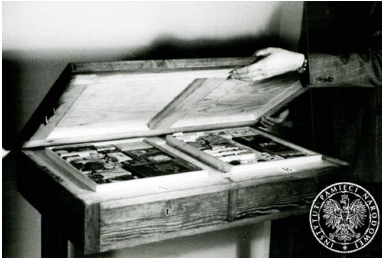
Stół ze skrytkami na materiały legalizacyjne, 1948 r.