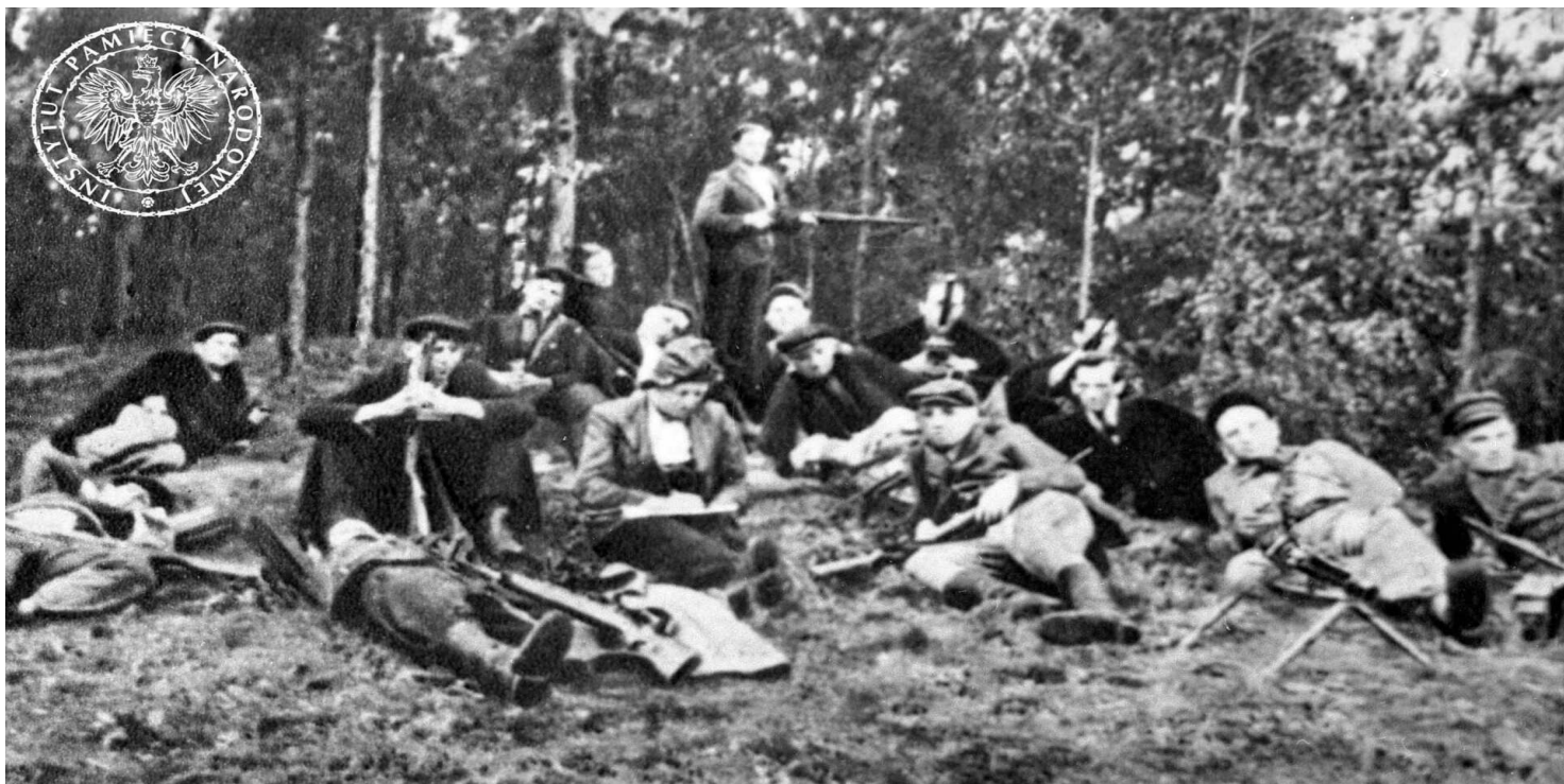
Grupa partyzantów Gwardii Ludowej podczas wypoczynku w lesie, 1942-1944

https://przystanekhistoria.pl/pa2/teksty/101430,Zbrojne-ramie-PPR-Akcje-bojowe-Gwardii-Ludowej.html