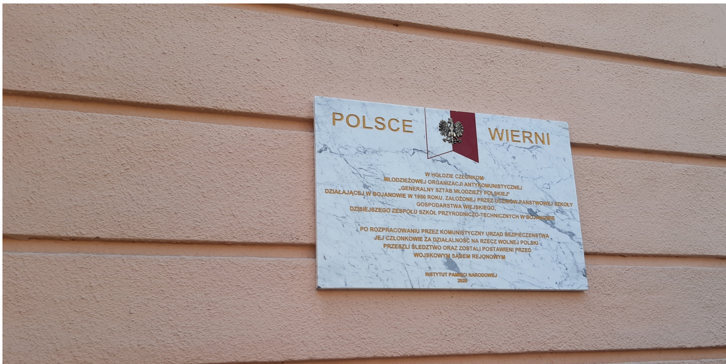
Tablica poświęcona młodzieżowej organizacji antykomunistycznej Generalny Sztab Młodzieży Polskiej w Bojanowie

https://przystanekhistoria.pl/pa2/teksty/101395,Generalny-Sztab-Mlodziezy-Polskiej-w-Bojanowie.html