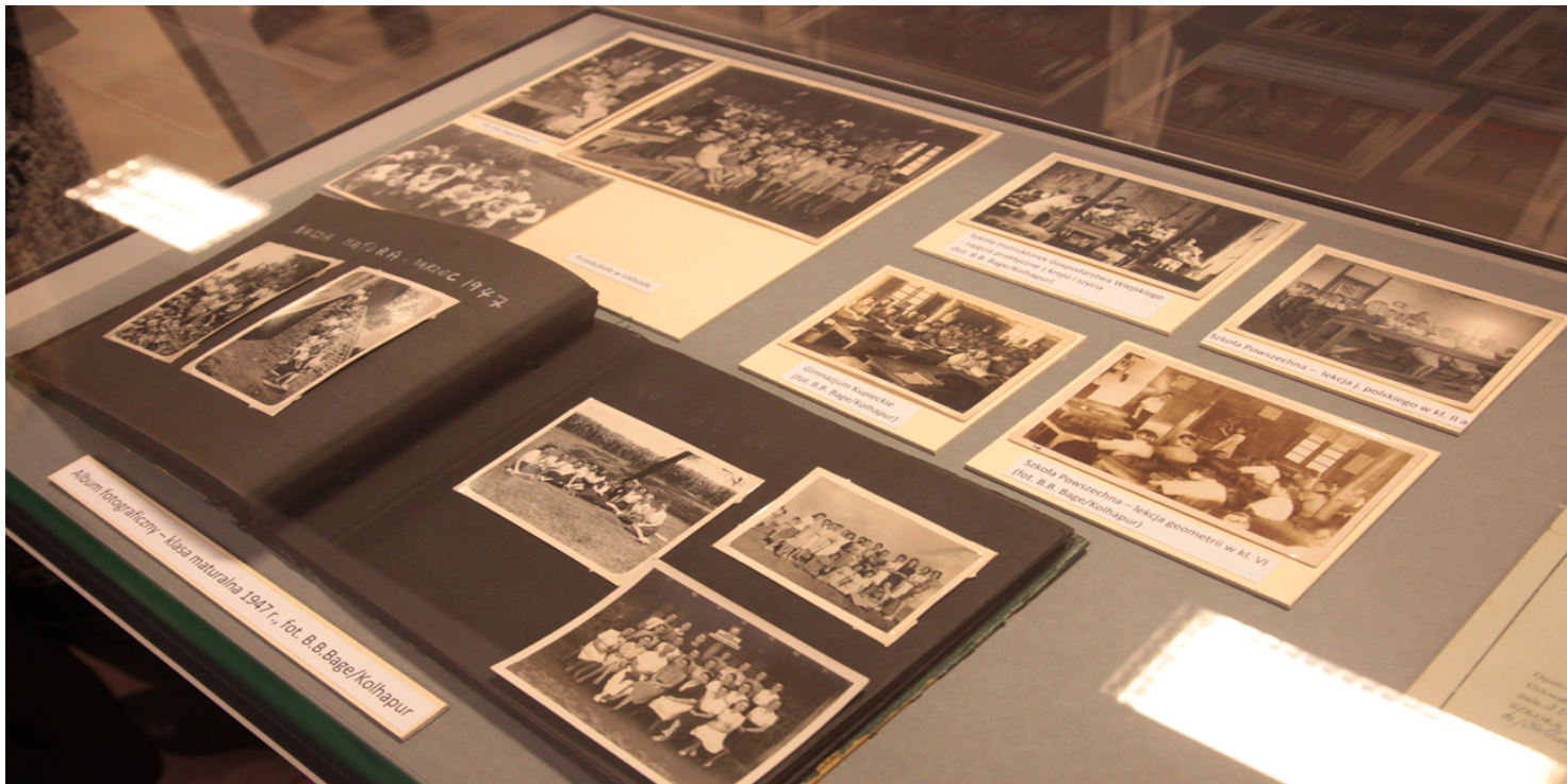
Prezentacja materiałów Koła Polaków z Indii 1942-1948 przekazanych do Archiwum IPN, 2019 r.

https://przystanekhistoria.pl/pa2/teksty/101178,Macierzynstwo-na-Szlaku-nadziei-Polskie-matki-w-materialach-Kola-Polakow-z-Indii.html