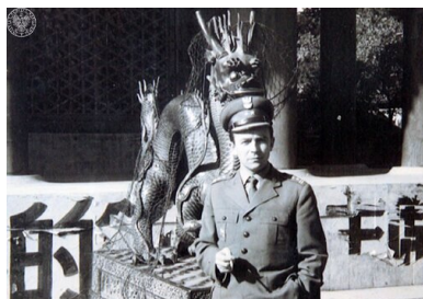
Ppłk Ryszard Kukliński w Pekinie, ok. 1967 r.

Po trwającym ponad dwa lata śledztwie, 13 marca 1984 r., Naczelna Prokuratura Wojskowa skierowała do Sądu Warszawskiego Okręgu Wojskowego akt oskarżenia. Obejmował on dwa generalne zarzuty tj. trwałe uchylanie się od służby wojskowej poprzez opuszczenie macierzystej jednostki i nielegalny wyjazd z kraju oraz działanie na rzecz wywiadu USA poprzez przekazywanie mu „informacji godzących w podstawy bezpieczeństwa i obronności PRL”. Prokuratura jednocześnie wniosła o rozpoznanie sprawy w trybie postępowania w stosunku do nieobecnych, z wyłączeniem jawności.