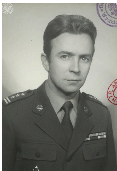
Zdjęcie portretowe Ryszarda Kuklińskiego w mundurze pułkownika.

Do najważniejszych osiągnięć Kuklińskiego, oprócz dostarczenia Centralnej Agencji Wywiadowczej (CIA) tajnych dokumentów strategicznych Układu Warszawskiego, należało przekazanie na Zachód planów wprowadzenia stanu wojennego w Polsce. W ówczesnej sytuacji społecznej i geopolitycznej było to zarówno dla PRL, jak i dla Związku Sowieckiego, ciosem niezwykle dotkliwym, który nie mógł pozostać bez reperkusji.