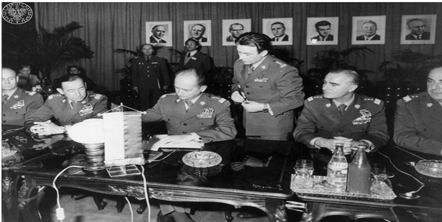
Płk Ryszard Kukliński asystujący gen. Wojciechowi Jaruzelskiemu w siedzibie głównej Układu Warszawskiego, 1979 r.

https://przystanekhistoria.pl/pa2/teksty/101145,Ryszard-Kuklinski-Czlowiek-ktory-umknał-Moskwie.html