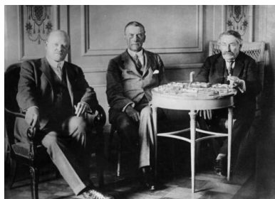
Gustav Stresemann, Austen Chamberlain i Aristide Briand w Locarno, 1925 r.

przyznawanym na trzy lata, z możliwością ponownego wyboru po upływie kadencji.