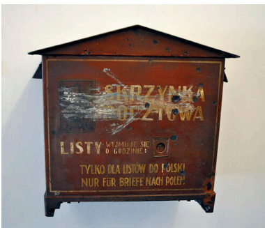
Skrzynka na listy Poczty Polskiej

Tymczasem do napięć w stosunkach polsko-gdańskich dochodziło często z błahych, zdawałoby się, powodów. W istocie rzeczy były to po prostu próby podważania bądź obchodzenia odpowiednich postanowień traktatu wersalskiego i zawartych na jego podstawie porozumień. Tego typu konfliktem stał się spór o prawo do zawieszania przez stronę polską własnych skrzynek pocztowych z godłem państwowym. Były one zamalowywane przez niemieckich nacjonalistów w Gdańsku barwami byłego cesarstwa. Spory polsko-gdańskie rzutowały na całokształt stosunków polsko-niemieckich i opierały się zwykle o Ligę Narodów. Dodajmy, że spór o skrzynki pocztowe, których w całym Gdańsku polscy pocztowcy zawiesili aż... dziesięć, rozstrzygnięty został ostatecznie w 1925 r. na korzyść strony polskiej.