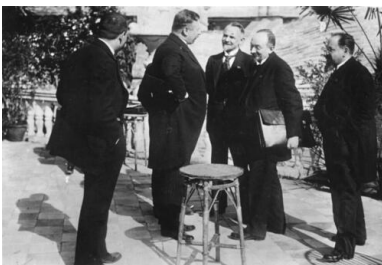
Podpisanie układu w Rapallo, 1922 r.

Zdawać się mogło, iż zagrożenie niemieckie będzie można neutralizować poprzez działanie z innym, również zagrożonym rewizjonizmem krajem, Czechosłowacją. Rzut oka na mapę wystarczy, by stwierdzić, że mógł być to wymarzony sojusznik wojskowo-polityczny, i to sojusznik niejako naturalny. Stosunki polsko-czeskie były jednak oziębłe, a niekiedy wręcz wrogie, ich źródło tkwiło zarówno w konfliktach granicznych (Śląsk Cieszyński, Spisz, Orawa, Jaworzyna), jak też postawach ludzi kierujących polityką naszego południowego sąsiada. Ci zaś, z nielicznymi wyjątkami, do Polski odnosili się nieprzyjaźnie. Odmawiano Polakom, zwłaszcza w początkowym okresie, zdolności do zorganizowania samodzielnego państwa. Nie wierzono też, że będzie ono tworem trwałym. W Polsce zaś, po części prawem rewanżu, Czechosłowację uznawano za twór sztuczny. Rezultatem konfliktów terytorialnych i personalnych zadrażnień była szkodliwa rywalizacja, utracanie wzajemnych inicjatyw, popieranie odśrodkowych tendencji w państwie sąsiada. I choć w listopadzie 1921 r. doprowadzono nawet do podpisania układu politycznego, to jednak jesienią roku następnego dokument ten, nieratyfikowany przez Sejm, był już zwykłą kartką papieru. Najdłużej też, bo aż do wiosny 1924 r. ciągnął się polsko-czeski spór o Jaworzynę, rozstrzygnięty ostatecznie na korzyść naszego południowego sąsiada.