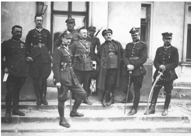
Oficerowie (którzy opowiedzieli się po stronie Józefa Piłsudskiego) na schodach przed Belwederem, maj 1926

rozproszeni wśród ugrupowań politycznych, otwarcie negowali model ustrojowy, którego konsekwencją stawało się stopniowe podporządkowywanie interesów państwa doraźnym partyjnym czy wręcz koteryjnym korzyściom. Afery, głównie o podłożu gospodarczym, arogancja i niekompetencja biurokracji, wreszcie coraz wyraźniej dostrzegalne zagrożenia zewnętrzne wytwarzały klimat sprzyjający umacnianiu się nastrojów antyparlamentarnych. W odczuciu coraz znaczniejszej części opinii publicznej potrzebny był człowiek „silnej ręki”, ktoś, kto przywróci wewnętrzną równowagę i będzie w stanie zapewnić na arenie międzynarodowej bezpieczeństwo Rzeczypospolitej.