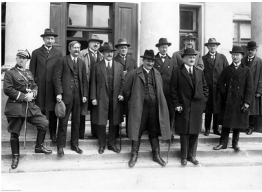
Rząd Wincentego Witosa, 11 V 1926 r.

Z aktywnego życia politycznego Józef Piłsudski zaczął się stopniowo wycofywać po objęciu urzędu prezydenta przez Stanisława Wojciechowskiego. Zbyt ciasne ramy konstytucyjne spowodowały, że o godność głowy państwa się nie ubiegał. Pozostawał jeszcze w wojsku, ale i tam, wobec rysującej się coraz wyraziściej tendencji do podporządkowania armii – poprzez parlamentarną odpowiedzialność ministra spraw wojskowych – sejmowi, nie było dla niego miejsca. Marszałek nie miał wątpliwości, że odejść musi, jednak zamierzał uczynić to w sposób demonstracyjny. Jego postawa miała uniemożliwić, a przynajmniej utrudnić, dowolne manipulowanie materią tak ważną i delikatną, jaką była dla niego obronność kraju.