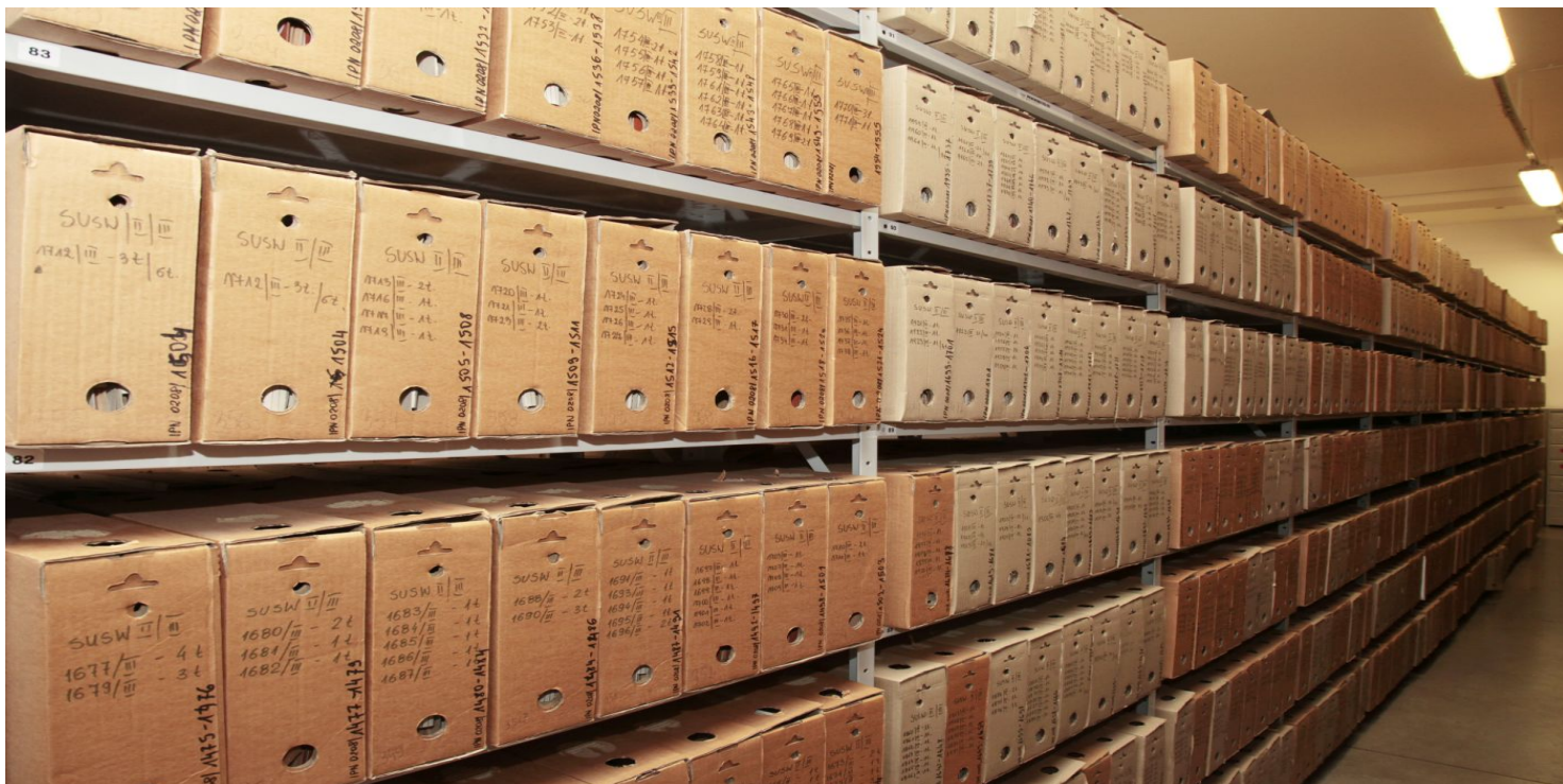
Magazyn archiwalny AI PN.

https://przystanekhistoria.pl/pa2/teksty/100665,Biali-Banici-z-Wrzesni-kontra-Gieorgij-Malenkow.html