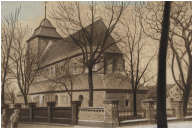
Kościół parafialny pw. Wniebowzięcia NMP i św. Stanisława BM we Wrześni. Fot. z ok. lat 20. XX w. ze zbiorów NAC

„Bracia rodacy dnia 5 marca minęła rocznica śmierci kata polskich oficerów zamordowanych w Katyniu. Zastępcą jego jest Malenkow. Podziemie”.