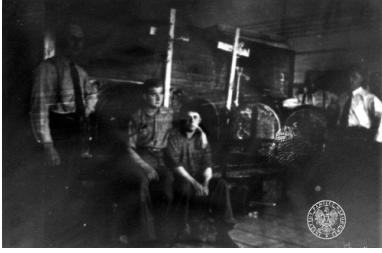
Wnętrze krematorium po wyzwoleniu. KL Buchenwald, 1945 r.

Więcej interesujących materiałów na profilu Archiwum IPN