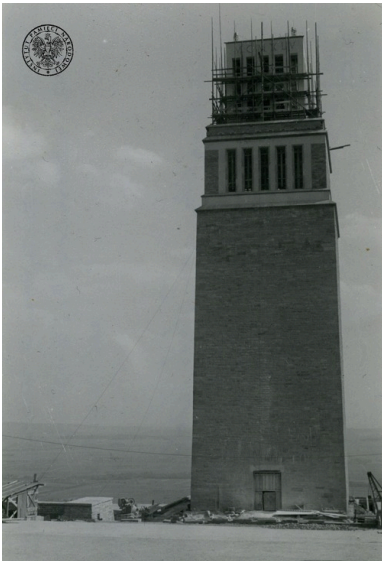
Wieża - pomnik ofiar faszyzmu w Buchenwaldzie (na Ettersberg k. Weimaru). Na odwrocie fotografii adnotacja o treści „Skrytka Złoto/Gold”