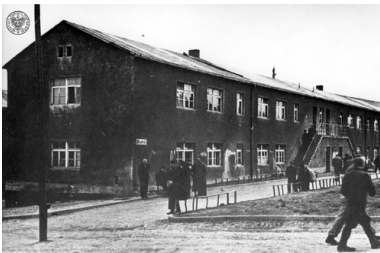
KL Buchenwald, blok 40., po wyzwoleniu, 1945 r.

Funkcje kapo w obozie oraz w zakładach zatrudniających więźniów przestali pełnić niemieccy kryminaliści, przejęli je komuniści, którzy w pewien sposób starali się „łagodzić reżim obozowy”. Pomimo to wśród więźniów