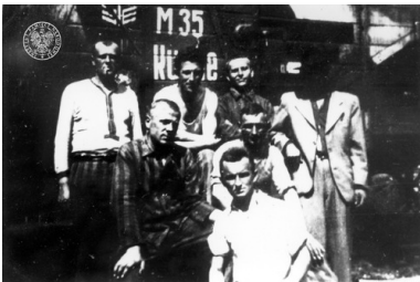
Grupa więźniów na tle rampy kolejowej. KL Buchenwald, b.d.