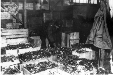
Magazyn łyżek na terenie KL Buchenwald