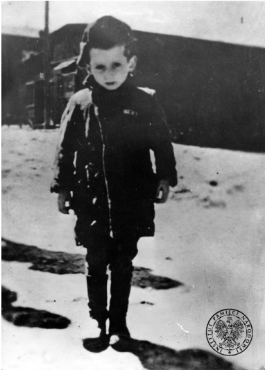
Dziecko - więzień KL Buchenwald