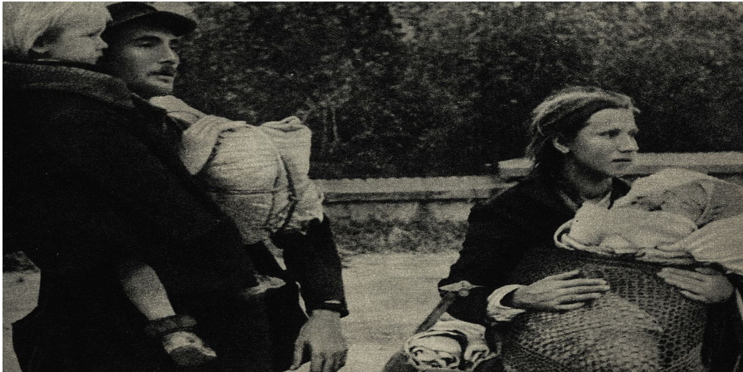
Polscy cywile opuszczający Warszawę podczas rozejmu w trakcie walk powstańczych, 7 września 1944 r. (domena publiczna)

https://przystanekhistoria.pl/pa2/teksty/100074,Ciezarne-robotnice-przymusowe-w-obozie-przejsciowym-w-Pile-Durchgangslager-Schne.html