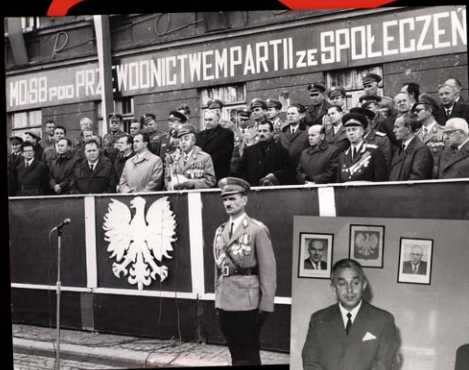
Trybuna honorowa przy budynku Poczty Głównej w Lublinie podczas przypadających 7 października uroczystości święta MO i SB (2 połowa lat 60-tych).