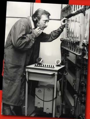
Skuteczna inwigilacja nie byłaby możliwa bez odpowiedniego zaplecza technicznego, które zapewniał Wydział „T” (technik operacyjnych).