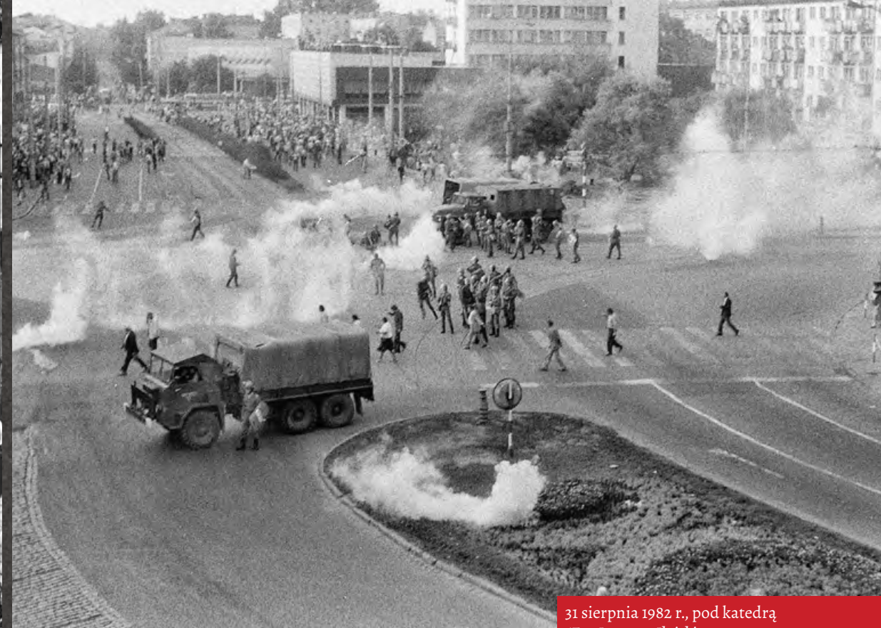
31 sierpnia 1982 r., pod katedrą