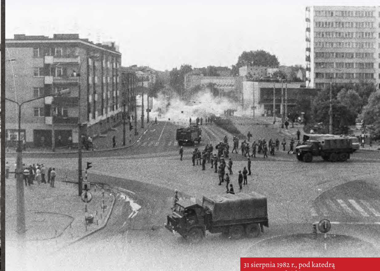
31 sierpnia 1982 r., pod katedrą