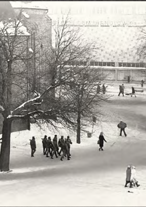
Patrol na ulicach Gorzowa Wlkp.

zakładowe. Zwiększono liczbę patroli milicyjnych i wojskowych oraz zmobilizowano oddziały „polityczno-obronne”. Jednocześnie władze gorzowskiego KW informowały o negatywnych czynnikach kształtujących nastroje, takich jak: trudności rynkowe i spadek poziomu życia, narastające poczucie braku perspektyw wyjścia z kryzysu gospodarczego i społecznego, upadek autorytetów moralnych, poczucie braku stabilizacji politycznej.