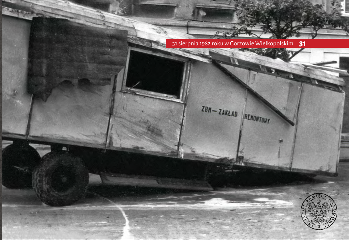
31 sierpnia 1982 roku w Gorzowie Wielkopolskim 31