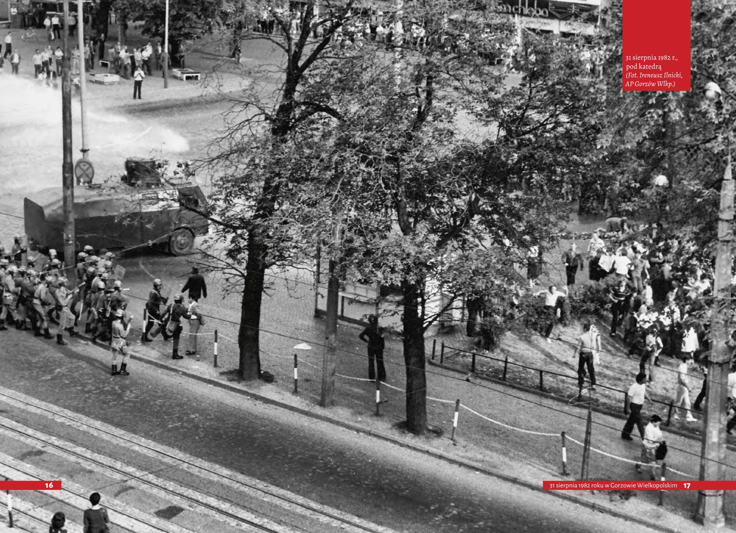
31 sierpnia 1982 r., pod katedrą