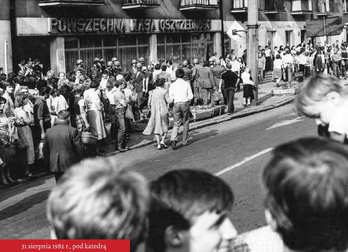
31 sierpnia 1982 r., pod katedrą