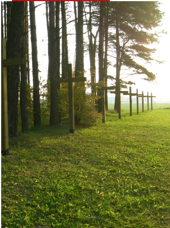
Uroczysko Kuropaty, 2017 r.

Operacja Antypolska NKWD 1937–1938 była jedną ze zbrodniczych akcji w ZSRS przeprowadzonych według kryteriów narodowościowych w okresie Wielkiego Terroru lat 30. Jej podstawę prawną stanowił rozkaz nr 00485 z 11 VIII 1937 r., wydany przez ludowego komisarza spraw wewnętrznych ZSRS Nikołaja Jeżowa. Wciąż nie znamy ostatecznej liczby osób represjonowanych w ramach tej zbrodni. Według ustaleń moskiewskiego niezależnego stowarzyszenia „Memorial” represje objęły co najmniej 139 835 osób, z czego nie mniej niż 111 091 zostało zamordowanych.