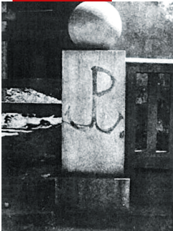
Jeden z pierwszych znaków kotwicy na werandzie cukierni Lardellego przy ul. Polnej, Warszawa 1942 r.

Znak Polski Walczącej, składający się z liter „P” i „W”, splecionych razem na kształt kotwicy malowano w czasie okupacji niemieckiej na murach. Miał on wzbudzać w Polakach wolę oporu i podtrzymywać nadzieję na odzyskanie niepodległości. Symbol najczęściej malowali harcerze z Organizacji Małego Sabotażu „Wawer”, wielokrotnie narażając przy tym swoje życie. Stał on się symbolem Polskiego Państwa Podziemnego (1939–1945), które było fenomenem na skalę światową. W konspiracji udało się stworzyć funkcjonującą strukturę władz cywilnych i największe podziemne siły zbrojne Europy – Armię Krajową. Polskie Państwo Podziemne, podporządkowane prawowitemu Rządowi Rzeczypospolitej Polskiej na Uchodźstwie, organizowało szeroko rozumiany opór przeciwko Niemcom i Sowietom.