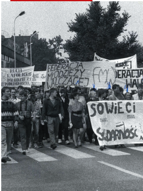
Manifestacja „Solidarności Walczącej”, Szczecin 1989 r.