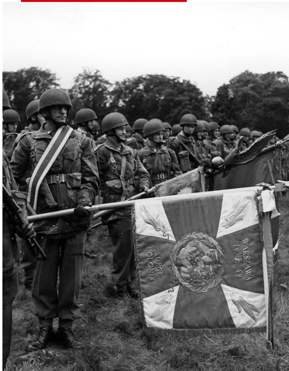
Wręczenie sztandaru 1 Samodzielnej Brygadzie Spadochronowej. Poczet sztandarowy z nowym sztandarem i inne poczty, 15.06.1944 r.

Cichociemni to żołnierze Polskich Sił Zbrojnych, którzy byli desantowani do okupowanej Polski podczas II wojny światowej w celu prowadzenia walki partyzanckiej z niemieckim okupantem, organizowania i szkolenia ruchu oporu w kraju oraz przygotowywania powstania powszechnego.