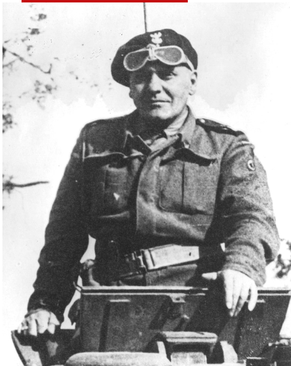
Stanisław Maczek, generał Wojska Polskiego, dowódca 1 Dywizji Pancерnej.

1 Dywizja Pancerna została sformowana na podstawie rozkazu Naczelnego Wodza, gen. broni Władysława Sikorskiego wydanego w dniu 25 lutego 1942 r. Jej dowódcą został gen. Stanisław Maczek. Pod koniec lipca 1944 r. dywizja została przerzucona do Normandii. Dywizja wzięła udział w Operacji Tractable, która miała spowodować okrążenie dwóch niemieckich armii w kotle w okolicach Falaise. Przez kilka dni żołnierze polscy toczyli zażarte walki o wzgórze Mont Ormel oraz miasteczko Chambois.