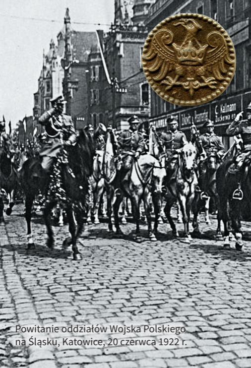
Powitanie oddziałów Wojska Polskiego na Śląsku, Katowice, 20 czerwca 1922 r.