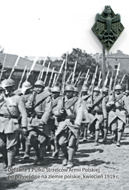
Defilada 1 Pułku Strzelców Armii Polskiej po przyjeździe na ziemię polskie, kwiecień 1919 r.