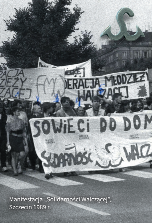
Manifestacja „Solidarności Walczącej”, Szczecin 1989 r.