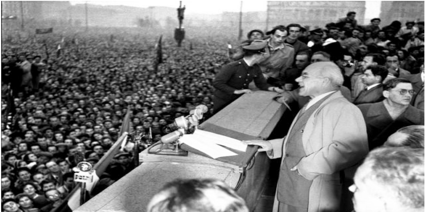
Władysław Gomułka przemawia na pl. Defilad w Warszawie, 24 października 1956

https://przystanekhistoria.pl/pa2/tematy/wladyslaw-gomułka/96132,Kontynuacja-po-przełomie.html