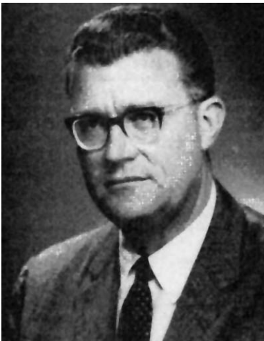
William Tapley Bennett, ambasador USA przy NATO w latach 1977 - 1983

„prawdopodobieństwo jest na tyle duże, że państwa Zachodu powinny podjąć wszelkie możliwe kroki w celu wpłynięcia na proces decyzyjny w ZSRS”.