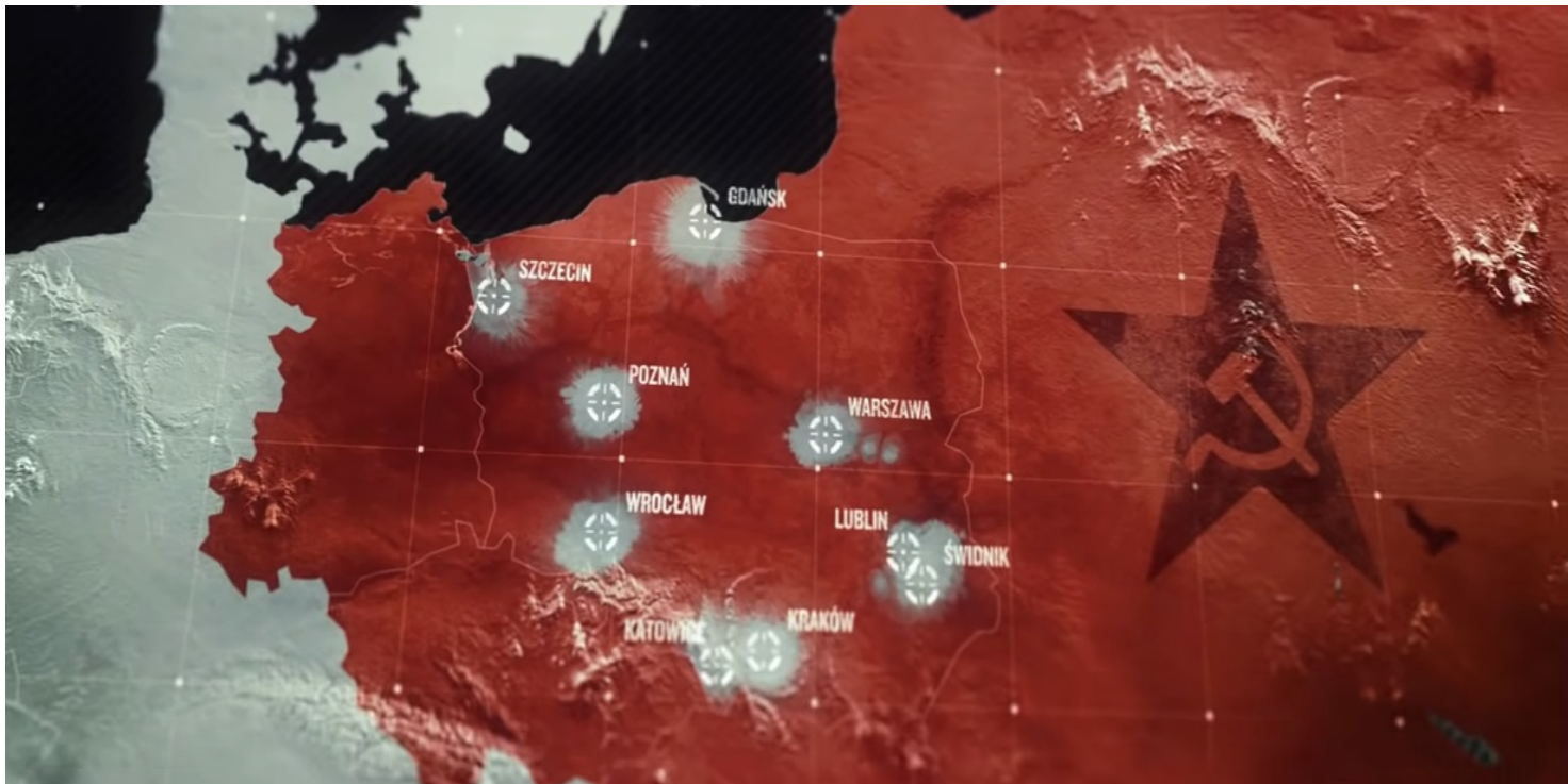
Kadr z filmu IPN "Niezwycczeni"

https://przystanekhistoria.pl/pa2/tematy/stosunki-miedzynarodowe/89660,Odstraszanie-przez-naglasnianie-Historyczny-kontekst-amerykanskej-dyplomacji-wo.html