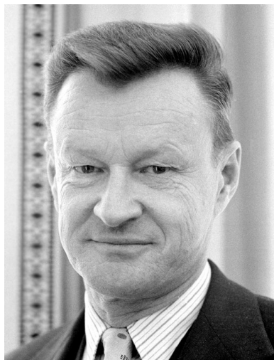
Zbigniew Brzeziński na fotografii z 1977 r.

W dyplomatyczną kampanię Amerykanie wciągnęli również Watykan i „Solidarność”. Zbigniew Brzeziński w tych dniach odbył krótką rozmowę z Janem Pawłem II. Starał się wykorzystywać kanały watykańskie do ostrzeżenia liderów „Solidarności” przed atakiem. Równolegle w raporcie amerykańskiego prezydenta dla kongresowej komisji do spraw KBWE informowano o ostrych atakach na Jacka Kuronia, Komitet Obrony Robotników i Konfederację Polski Niepodległej. Departament Stanu odradzał zaś obywatelom amerykańskim indywidualne wyjazdy do Polski.