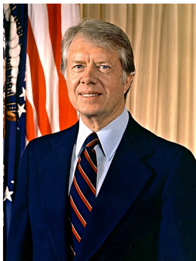
Prezydent USA Jimmy Carter na fotografii z 1977 r.

Tego samego 7 grudnia 1980 r. amerykańska administracja napędce przygotowała wraz z europejskimi stolicami (za pomocą serii telegramów) linię postępowania na wypadek ziszczenia się scenariusza inwazji: atak miał implikować zerwanie relacji dyplomatycznych z Moskwą, embargo handlowe oraz zerwanie rozmów rozbrojeniowych. Nie było więc mowy o jakichkolwiek działaniach militarnych, choć wśród luźnych pomysłów pojawiła się nawet propozycja blokady Kuby jako sankcji za akcję radziecką. Realne możliwości działania były ograniczone – znowu nikt nie zamierzał „umierać za Gdańsk”. Istotne było jednak samo zadeklarowanie – co prawda ogólnikowe – jedności reakcji Zachodu w obliczu poczynań ZSRS.