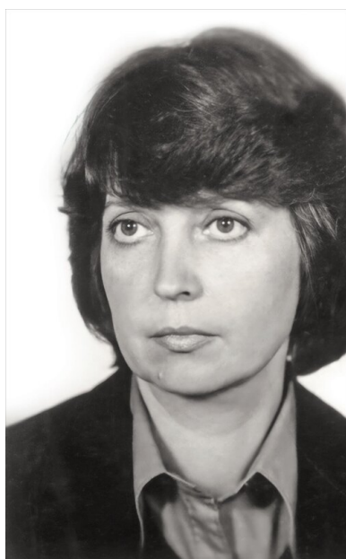
Alicja Grześkowiak