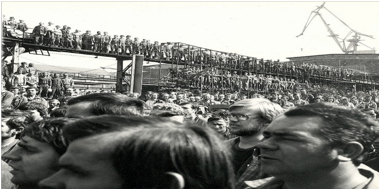
Pracownicy Stoczni Warszawskiej na wiecu, sierpień 1980 r.

https://przystanekhistoria.pl/pa2/tematy/solidarnosc/104679,Przywodca-robotniczych-serc-Aleksander-Krystosiak-19222002.html