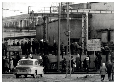
Strajk w Stoczni Warszawskiej, styczeń 1971 r.