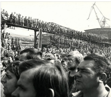
Pracownicy Stoczni Warszawskiej na wiecu, sierpień 1980 r.

W dużych zakładach pracy spotykało się większą różnorodność typów ludzkich, a środowisko zakładowe było znacząco mniej uładzone i podatne na indoktrynację niż inteligencja. Reprezentacja robotnicza kształtowała się według szczególnych reguł zarówno w czasie rewolty grudniowej z 1970 r. oraz strajku Bałuki ze stycznia 1971 r., jak i strajku sierpniowego 1980 r., podczas których o wyborze przywódców decydowały nie wykształcenie, zawód czy członkostwo w PZPR, ale szacunek wynikający z cech osobowości, wiarygodności i siły.