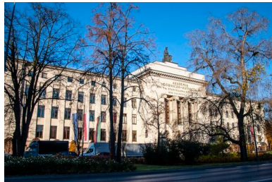
Gmach Akademii Górniczo Hutniczej w Krakowie, 2021 r.

socjalne, takie jak przydział wczasów, mieszkań zakładowych, funkcjonowanie stołówki zakładowej. Związek popierał również starania o przywrócenie uczelni autonomii i samorządności poprzez wprowadzenie zasady obieralności władz uczelni: Senatu i władz rektorskich. Nowo wybrany w 1981 r. Senat w większości składał się z sympatyków i członków „Solidarności”.