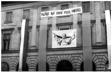
Kraków. Klasztor Zgromadzenia Księży Misjonarzy (widok od strony ul Stradomskiej), 18 VI 1983 r.

Tekst stanowi fragment książki „Dawniej to było. Przewodnik po historii Polski” (2019) Całość publikacji dostępna w wersji drukowanej w księgarni internetowej ksiegarniaipn.pl