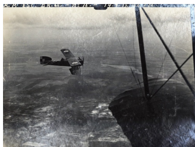
Samolot Bréguet XIVB2 w polskim malowaniu nad Wielkopolską, 14 lipca 1919 r.

w polskim lotnictwie wojskowym. W latach 1925–1939 był m.in. dowódcą II. dywizjonu w 3. Pułku Lotniczym, kwatermistrzem 3. Pułku Lotniczego w Poznaniu, komendantem bazy 6. Pułku Lotniczego we Lwowie (1932–1935) i Centrum Wyszkożenia Lotnictwa nr 1 w Dęblinie (1935–1936), wreszcie (już w randze podpułkownika) zastępcą szefa Kierownictwa Zaopatrzenia Lotnictwa w Warszawie (1936–1939). Wrzesień 1939 roku i napaść nazistowskich Niemiec na Polskę twardego Wielkopolanina bynajmniej nie złamały. Po przedarciu się przez Rumunię do Francji, a po jej upadku do Wielkiej Brytanii, Pniewski objął nad Tamizą stanowisko komendanta Obozu Lotnictwa Polskiego w bazach RAF w Blackpool i Dunholme-Lodge (1940–1945).