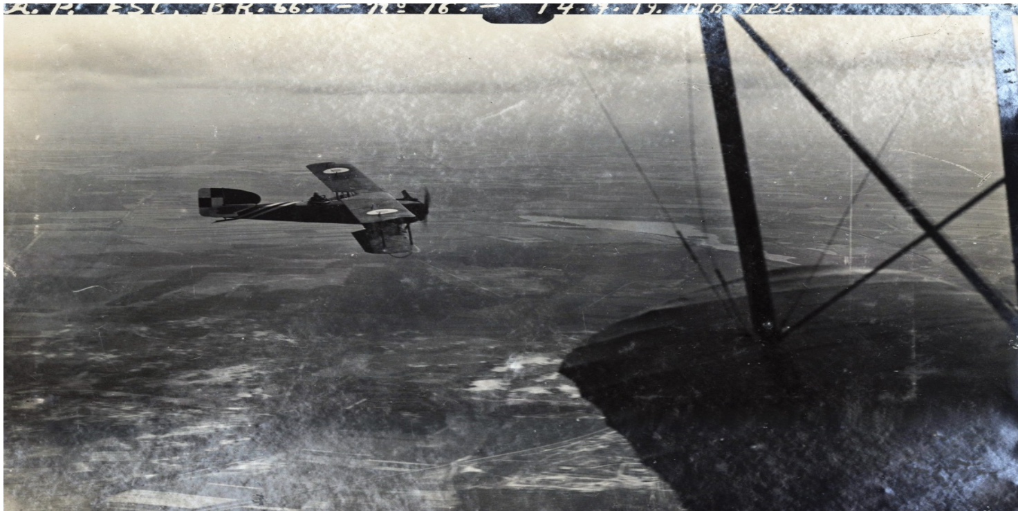
Samolot Bréguet XIVB2 w polskim malowaniu nad Wielkopolską, 14 lipca 1919 r.

https://przystanekhistoria.pl/pa2/tematy/polskie-wojsko/88757,Wiktor-Pniewski-18911974-w-sluzbie-Polskich-Skrzydel.html