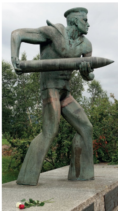
Pomnik polskich marynarzy w Narwiku upamiętniający poległych na ORP „Grom”.

Plan zakładał, że wspólnie z francuską 13. Półbrygadą Legii Cudzoziemskiej, alpejczykami oraz oddziałami norweskimi będzie uczestniczył w koncentrycznym ataku na Gratangen-Bjerkvik. 13 maja legioniści opanowali desantem z morza Bjerkvik, a 2. batalion podhalańczyków zajął półwysep Øyjord, który przekazał Francuzom. Wysiłek ten doprowadził do uchwycenia baz wyjściowych, z których wyprowadzono od północy uderzenie na Narwik. Następnie baon przerzucono kutrami na południową część półwyspu Ankenes. Tam dołączył do niego 1. batalion. Doszło wówczas do pauzy operacyjnej. Wyodrębniły się dwa główne odcinki działań: w rejonie Ankenes, gdzie operowali Polacy, oraz na północ od fiordu Rombaken, który obsadzili Francuzi i Norwegowie.