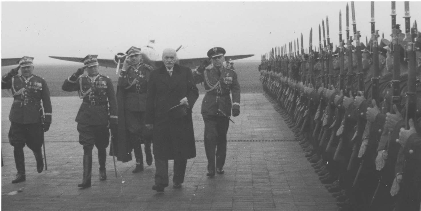
Gen. Józef Zając towarzyszy Prezydentowi RP Ignacemu Mościckiemu w przejściu przed frontem kompanii honorowej wojsk lotniczych na warszawskim Okęciu, 15 czerwca 1939 r.

https://przystanekhistoria.pl/pa2/tematy/polskie-sily-zbrojne-po/96576,General-Jozef-Zajac-dowodca-Wojsk-Polskich-na-Srodkowym-Wschodzie.html