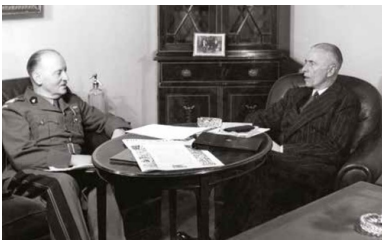
Gen. Władysław Sikorski i prezydent Władysław Raczkiewicz.