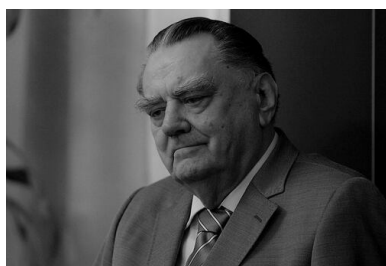
Jan Olszewski.

Po ogłoszeniu stanu wojennego pełnił funkcję doradcy w Sekretariacie Episkopatu Polski. Występował jako oskarżyciel posiłkowy w procesie morderców ks. Jerzego Popiełuszki. W 1988 r. współtworzył Komitet Obywatelski przy Przewodniczącym NSZZ „Solidarność” Lechu Wałęsie. Opowiadał się przeciwko dążeniu do porozumienia z komunistami. Odmówił objęcia z ramienia tzw. strony społecznej stanowiska przewodniczącego „podstolika” do spraw reformy prawa i sądów przy „okrągłym stole”.