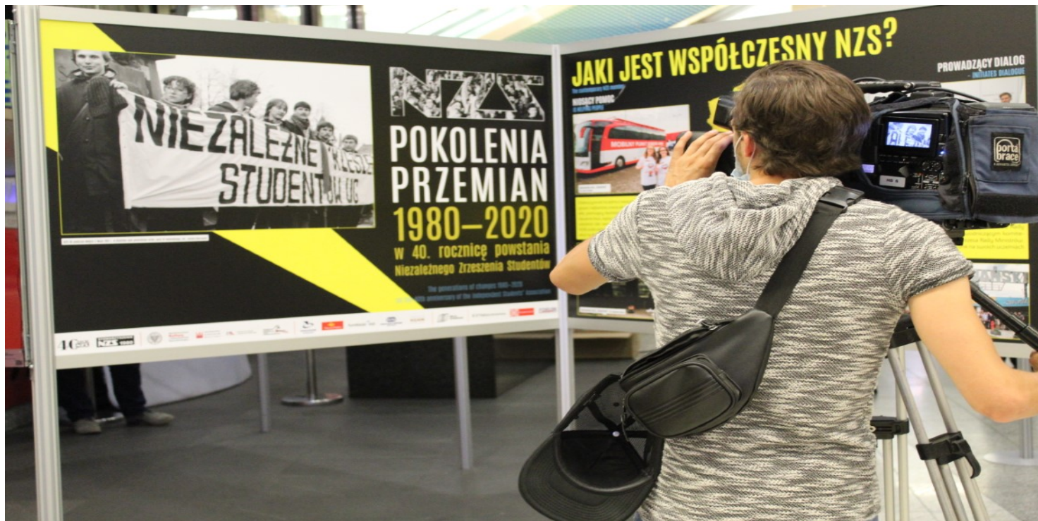
Odślonięcie wystawy „NZS – pokolenia przemian 1980-2020” na Dworcu Głównym w Krakowie.

https://przystanekhistoria.pl/pa2/tematy/niezalezne-zrzeszenie-s/87965,Bialostockie-Niezalezne-Zrzeszenie-Studentow-w-latach-1982-1983.html