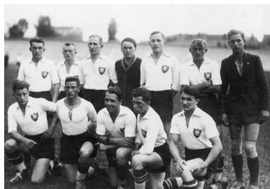
Fotografia grupowa piłkarzy z klubu sportowego Strzelec Siedlce im. płk. K. Hozera przed meczem z Legią Warszawa na stadionie w stolicy, sierpień 1934 r.