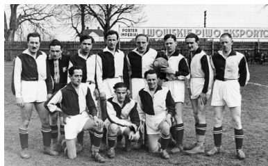
Drużyna piłkarska klubu sportowego Jutrzenka Lwów, 1935 r.

Inna legenda Cracovii, Józef Kałuża, w czasie II wojny światowej jako jeden z nielicznych członków zarządu PZPN pozostał w kraju. Ryzykując życiem, odrzucił wszystkie propozycje współpracy z niemieckimi władzami okupacyjnymi, np. objęcia stanowiska Sportführera w Generalnym Gubernatorstwie.