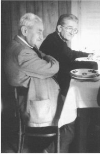
Jerzy Turowicz (redaktor naczelny "Tygodnika Powszechnego" w l. 1945-1953 i 1956-1999) i ks. Adam Boniecki MIC (redaktor naczelny "Tygodnika Powszechnego" w l. 1999-2011)