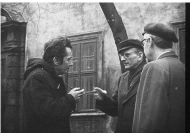
Krzysztof Kozłowski i Władysław Bartoszewski