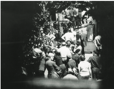
Zdjęcie uczestników protestu robotników w Radomiu wykonane przez SB z tzw. punktu zakrytego, 25 VI 1976 r.

Wypełnianie pierwszej funkcji polegało na fizycznej eliminacji osób i środowisk uznanych za zagrożenie lub potencjalne zagrożenie dla partii; drugiej – na zdobywaniu wiedzy o osobach, środowiskach i zjawiskach (trendach, procesach społecznych) traktowanych przez komunistów jako niebezpieczne bądź ważne dla funkcjonowania reżimu; trzeciej – na ochronie partii przed niepożądanymi zjawiskami i działaniami; czwartej zaś – na wywieraniu zakulisowego, niejawnego wpływu na rzeczywistość. Ostatnia funkcja była usługowa wobec represyjnej i profilaktycznej.