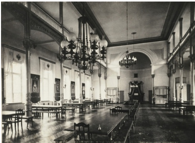
Na fotografii z 1902 r. wnętrze budynku Instytutu Aleksandryjsko-Maryjskiego, który był pierwszą siedzibą parlamentu w II RP.

Odpowiedzią na tę propozycję stał się wybuch, w nocy z 2 na 3 maja 1921 r., kolejnego, trzeciego już powstania. Zryw był najpotężniejszy z dotychczasowych – powstańcy szybko osiągnęli linię Odry. Polityczny błąd Korfanteo, który uznał, że powstanie osiągnęło swój cel i można wrócić do domów, sprawił, że o ziemię śląską trzeba było, w znacznie już trudniejszych warunkach militarnych, nadal krwawo się zмагаć. Powstańcy niejednokrotnie dawali przykłady odwagi, zaciętości i determinacji, wspomnieć należy choćby bitwę pod Górą św. Anny. Ostatecznie Rada Ligi Narodów, w kilka miesięcy po przerwaniu walk, podjęła kompromisową decyzję, na mocy której Polska otrzymała zaledwie 29% terytorium plebiscytowego z około 46% ludności, ale za to z bardzo cennymi z gospodarczego punktu widzenia obiektami przemysłowymi.