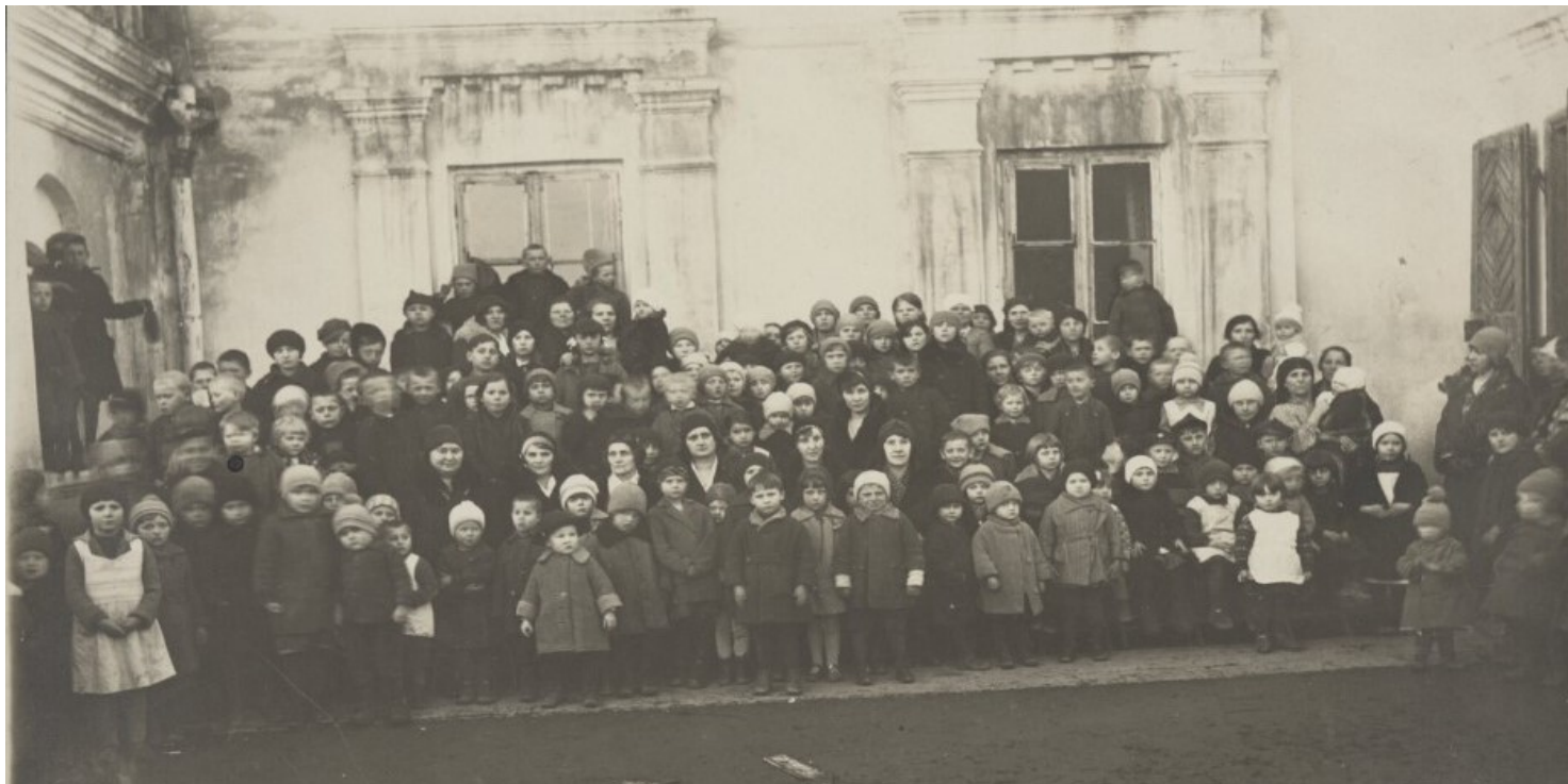
Dziatewa Sieradza zgromadzona na podwieczorku urzadzonym przez Zwiqzek Pracy Obywatelskiej Kobiet z okazji imienin Marszalka Polski Józefa Piłsudskiego, 24 marca 1931 r.

https://przystanekhistoria.pl/pa2/tematy/jozef-pilsudski/64215,Najwazniejszy-dzien-dla-pilsudczykow-Rzecz-o-i-mieninach-Pierwszego-Marszalka-Pol.html